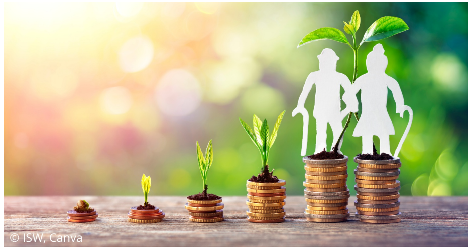
Eine private Vorsorge ist heutzutage unverzichtbar.

Ihre Familie ist geschützt: Im Todesfall zahlt die Versicherung das bis dahin angesammelte Guthaben als Rente an Ihre