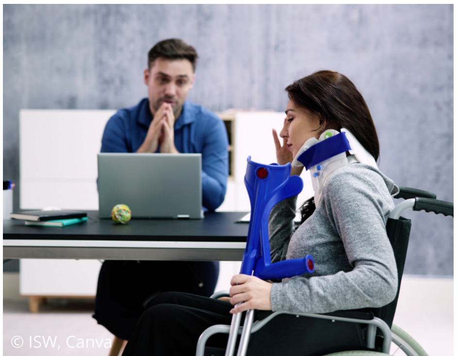
Laut der Deutschen Rentenversicherung wird etwa ein Viertel aller Erwerbstätigen im Laufe ihres Lebens mindestens einmal berufsunfähig.

Gemäß der Deutschen Rentenversicherung wird etwa ein Viertel aller Erwerbstätigen im Laufe ihres Lebens mindestens einmal berufsunfähig. Hauptursachen sind psychische Erkrankungen, gefolgt von Skelettbeschwerden und Krebserkrankungen. Somit betrifft das Risiko einer Berufsunfähigkeit nicht nur kör-